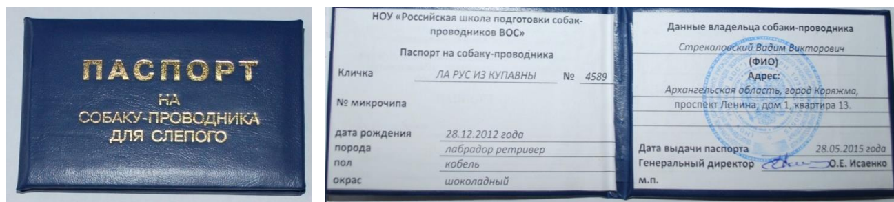
Рисунок 2. Образец паспорта собаки-проводника для незрячего инвалида.

Следует проверить наличие у инвалида с собакой паспорта собаки-проводника для незрячего (документ, подтверждающий ее специальное обучение). Образец действующего паспорта (рис.2):