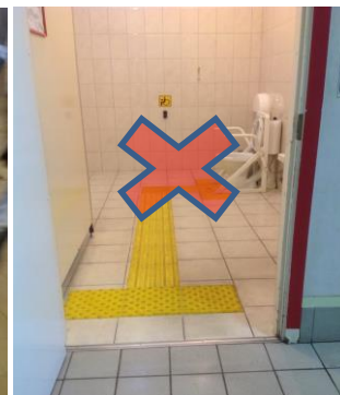
Фото 1, фото 2 – маршрут движения инвалида по зрению, выполненный в виде наклеенных на поверхность тактильных ПВХ плиток с различным рисунком (рифы в шахматном порядке, диагональные рифы, параллельные рифы).

Фото 3 – маршрут движения инвалида по зрению в санузле, выполненный в виде наклеенных на поверхность тактильных ПВХ плиток с различным рисунком.